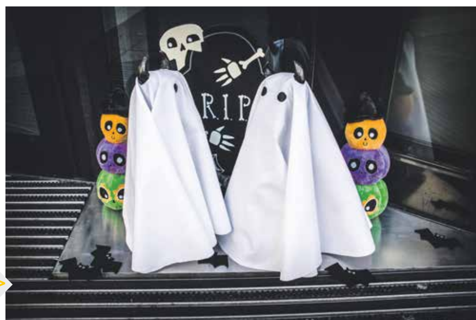
Frelka i Miglanc przed Galerią Katowicką stroją się przy każdej nadarzającej się okazji