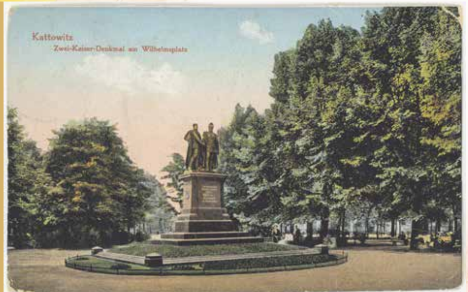
fol. Muzeum Śląskie