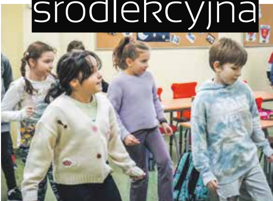
Wizualizacja: Blank Architekci

WSPÓLNY TANIEC NA SZKOLNEJ AULI PODCZAS PRZERWY? KRÓTKIE ĆWICZENIA LUB TAŃCE W TRAKCIE LEKCJI? DO TEJ PORY TAKA SYTUACJA WYDAWAŁA SIĘ MOŻLIWA TYLKO W MUSICALACH, KTÓRYCH AKCJA ROZGRYWAŁA SIĘ W SZKOŁACH, JEDNAK NIEBAWEM MOŻE SIĘ TO STAĆ RZECZYWISTOŚCIĄ. RUSZA PROJEKT „SZKOLNA AKTYWNOŚĆ FIZYCZNA”, KTÓRY MA ZACHĘCIĆ SZKOŁY DO WPROWADZANIA ĆWICZEŃ ŚRÓDLEKCYJNYCH, A TAKŻE AKTYWNYCH PRZERW.