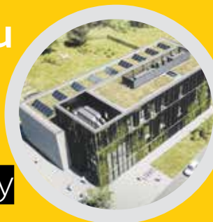
Wizualizacja: Blank Architekci

Na osiedlu Witosa w Katowicach powstanie nowy miejski dom kultury. Jego głównym punktem będzie wielofunkcyjna, wytłumiona akustycznie sala z 200 miejscami siedzącymi, sceną z pianinem, profesjonalnym zapleczem technicznym i reżyserką. W nowym obiekcie przewidziana jest również pracownia ceramiczna, a budynek ma otaczać nowy park. Właśnie wyłoniono wykonawcę tej inwestycji.