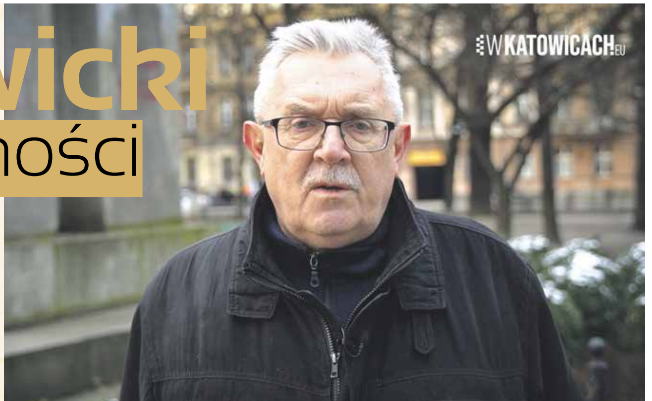
fol. P. Fuglewicz

Jeden z dwóch najstarszych placów w mieście. W pierwszym niemieckim planie zabudowy Katowic z 1865 r. ówczesny Wilhelmsplatz sytuowany był na głównej osi miejskiej, wyznaczonej dziś przez ul. 3 Maja, Rynek i ul. Warszawską. Gdy Katowice jeszcze nie posiadały praw miejskich, obok placu stanął w 1860 r. pierwszy na terenie Katowic kościół katolicki z muru pruskiego. Kościół wyburzono w okresie gwałtownej rozbudowy śródmieścia na przełomie XIX i XX wieku.